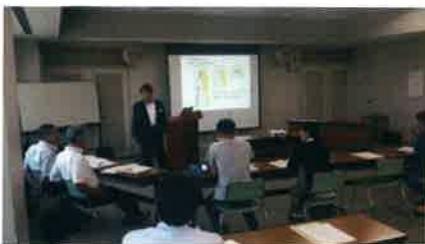
ワークショップ風景(イメージ)

東京海上日動火災保険(株)様に協力頂き、「BCPワークショップ」を無料開催致します。