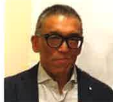
【講師】 もてぎWebマーケティング代表