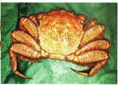
北海道オホーツク産 毛ガニ 1kg